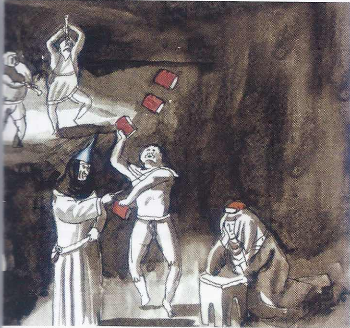
Concept-scène in de voorstelling Bosch's Dreams of 7Fingers , geïnspireerd op 'De extractie van de Steen van Waanzin', schilderij van Jheronimus Bosch